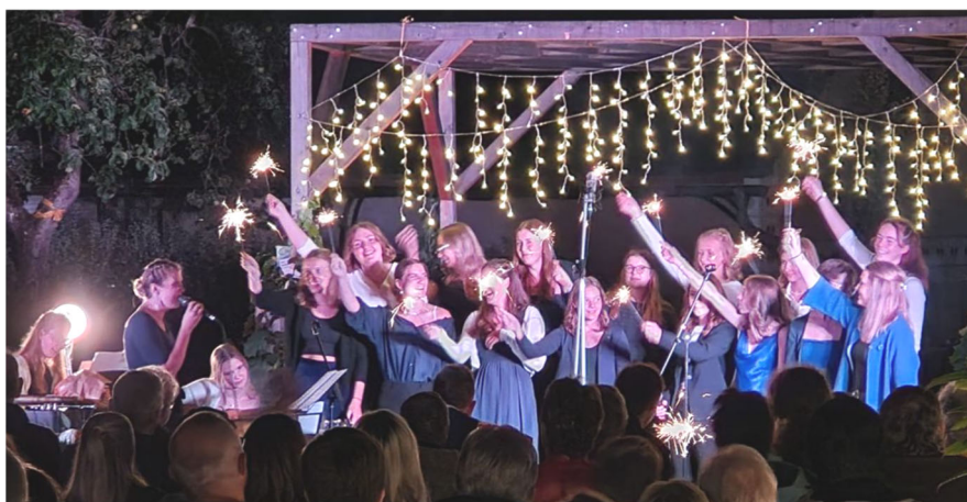
„Bis zum Mond“ - Beim Sommernachtskonzert begeisterte der Jugendchor das Publikum

Im Rahmen des Jubiläumsjahres fand im Pfarrhofgarten auch das Sommernachtskonzert „Bis zum Mond“ statt. Viele Zuhörer konnten die abwechslungsreichen Darbietungen bei Mondlicht bestaunen und genießen.