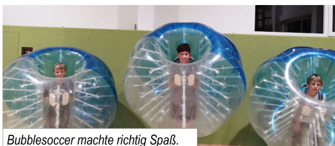
Bubblesoccer machte richtig Spaß.