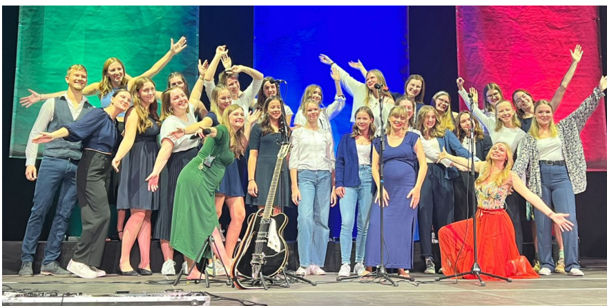
Der Lunzer Jugendchor im VAZ St. Pölten mit den Poxrucker Sisters

Hits wurden gemeinsam mit den Stars zum Besten gegeben. Wir gratulieren dem Jugendchor und wünschen allen viel Freude!