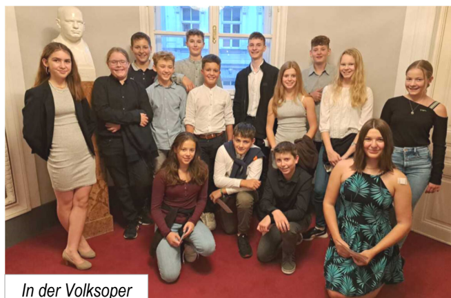
In der Volksoper