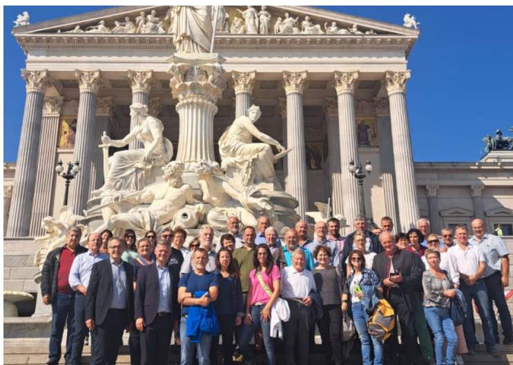
Die Belegschaft der Gemeinde vor dem Parlament in Wien

Nach dem Mittagessen nahmen wir im Stadtzentrum an der Führung durch einen historischen, denkmalgeschützten Apothekenkeller mit Labor teil.