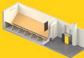
ETA-Austragschnecke mit bis zu 5 m Schneckenlänge