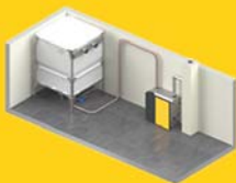
ETAbox Speed in 7 verschiedenen Größen

Sie haben die Wahl - je nach Beschaffenheit des Lagerraumes gibt es 4 verschiedene Austragungen: (nicht im Lieferumfang des Pakets enthalten)