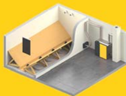
ETA-Saugsonden mit automatischer Umschaltung mit 4 Saugsonden